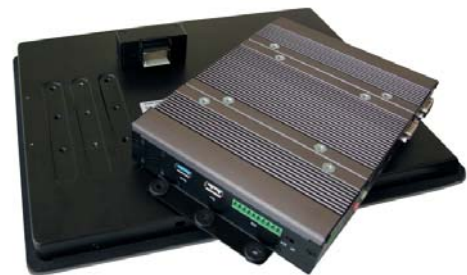
PC Modul + Display = Panel-PC