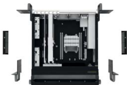
Wand-, Tisch-, Untertisch-Montage mit Montagewinkel im Lieferumfang enthalten