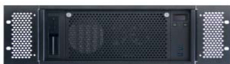
19"-Rack Montage über optionale Montagewinkel