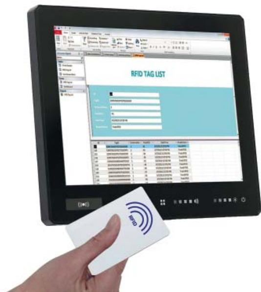
Spectra-Panel Silent-WDL mit internem RFID-Leser

Spectra unterstützt bei der Umsetzung von RFID Projekten. Hier zwei Beispiele für mögliche RFID-Lösungen mit internem oder externem RFID-Leser.