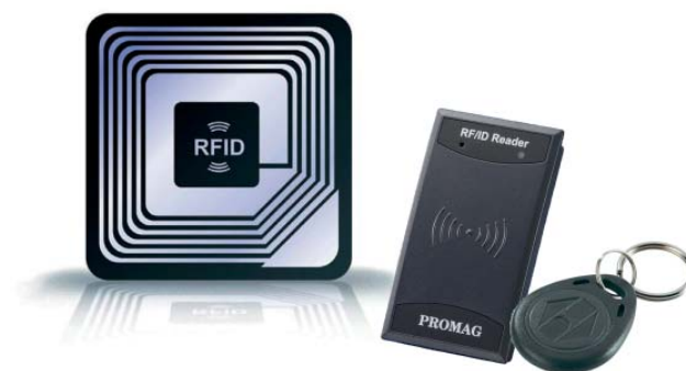
Komponenten für eine externe RFID-Leser Lösung