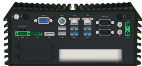
Spectra PowerBox 31F mit 1x PCIe Erweiterungssteckplatz