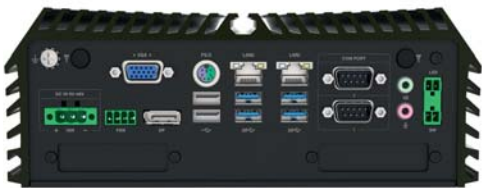
Spectra PowerBox 30F ohne PCIe Erweiterungssteckplatz